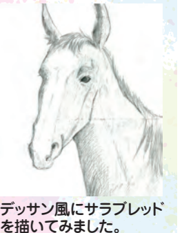
デッサン風にサラブレッドを描いてみました。