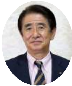
グループホーム ひだまりの家