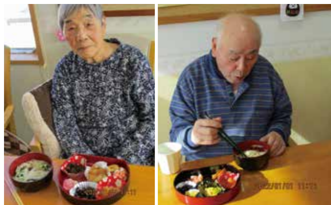
元旦の日、おせち料理を前にして。「黒豆縁起いいんだよな」