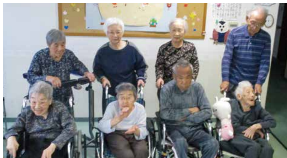
3階「空ユニット」のみなさん。「この通り元気だからね」