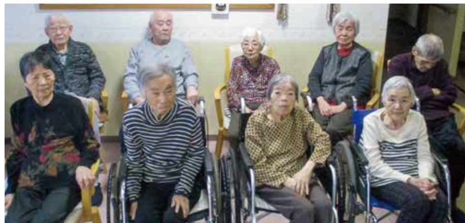
2階「海ユニット」のみなさん。「コロナ収まったらまた会いに来てね」