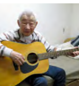
「ひだまりに来てもう9年が経つたよ。いつもありがとね」最高年齢98歳 Y.F.さん