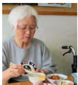
「今の唄うまかつたな」聞き惚れ拍手を送る T.H.さん