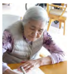
「みんな元気かい、私もこの通り...手紙を認める M.S.さん」