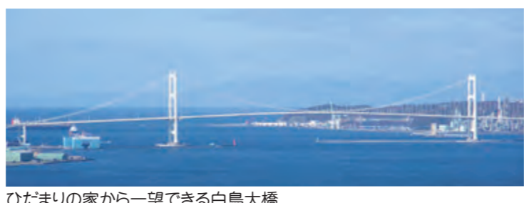
ひだまりの家から一望できる白鳥大橋