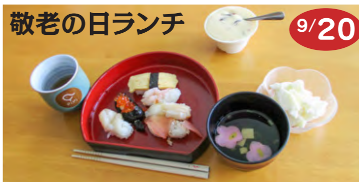
敬老の日のお昼、「握り寿司」を食べ皆でささやかなお祝いをしました。来年秋は恒例の「敬老の集い」の復活を心待ちにしています。