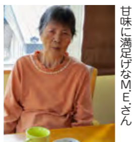
「ひだまりの家にきて初めての誕生日会、コロナ禍でご家族も参加出来ず残念です。でも息子さん娘さんからプレゼントとご家族の写真額が届き、満悦。」