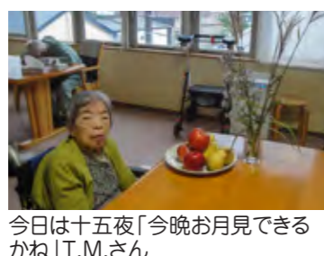
今日は十五夜「今晚お月見できるかね」 T.M.さん