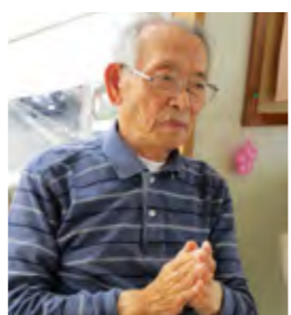
「いや〜昔はギター弾いて唄ったもんだよ」ほろろ〜と T.S.さん