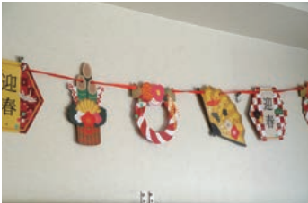
『迎春』玄関の壁にはお正月飾りが、今年も良い年で...