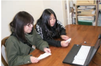
お孫さん、ひい孫さんがリモート面会に「おばあちゃん元気〜」