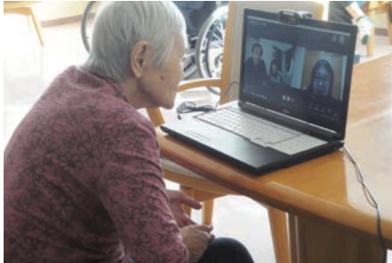
遠い和歌山、横浜とオンラインでリモート面会「分かるかい？」