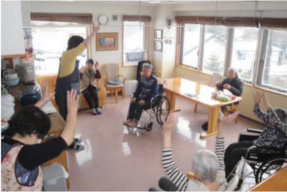
2階「海」ユニット、10時毎朝恒例の「北国の春」体操から