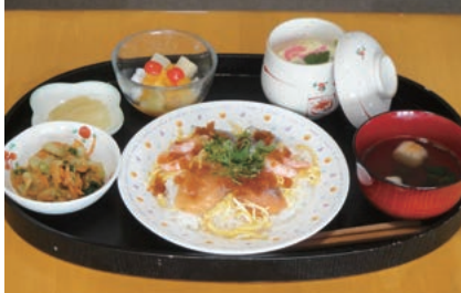
昼食 生ちらし寿司（えび・しめ鯖・サーモン・とびこ・錦糸卵・青じそ） 茶碗蒸し（鶏肉・椎茸・ゆり根・なると・三葉） にんじんとチンゲン菜の胡麻和え すまし汁（麴・ねぎ）、香の物 デザート（フルーツミックス）