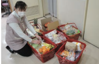
月・水・金の食材買い出し、いつも一度にこれくらゐの量が