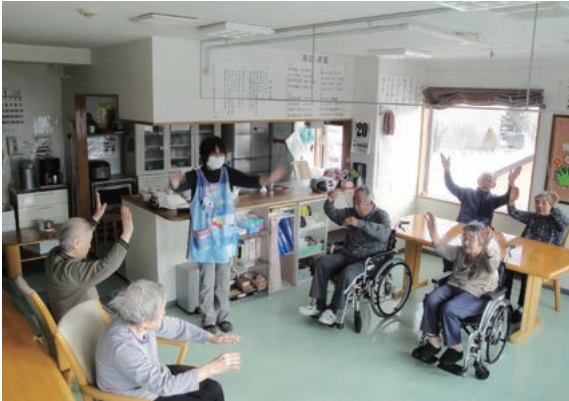
3階「空」ユニット、♪白樺 青空 南風 こぶし咲く...