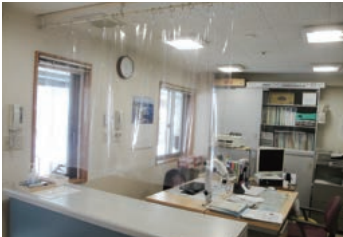
1階事務所のカウンターの upper は 予防用の透明カーテンが