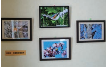
階段踊り場には季節ごとに変わる野鳥の写真が展示