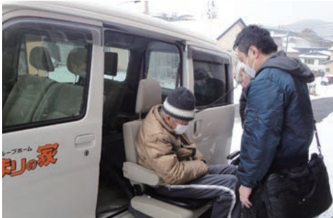
通院・受診にはリフト付きの送迎車両で