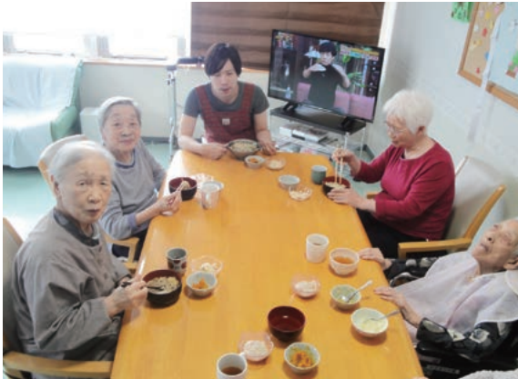
大晦日の昼食は「年越しそば」を食し来年も無病息災を