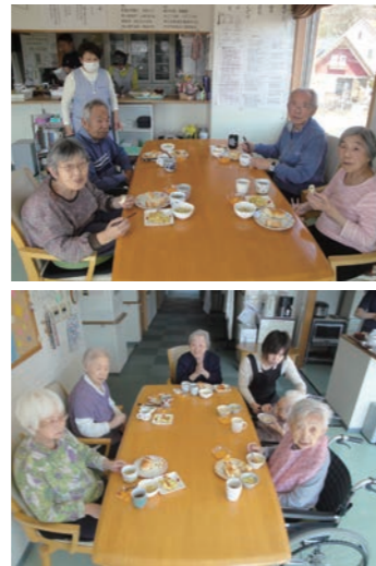
お昼の時間帯、この日のメニューはロールパン・アスパラベーコンのキッシュ・コールスロー・コーンスープ・フルーツ。「このキッシュ、ハイカラでおいしいよ」