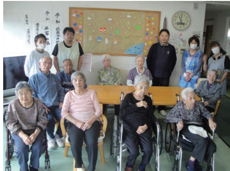
3階「空ユニット」 面会できる日楽しみにしているからね