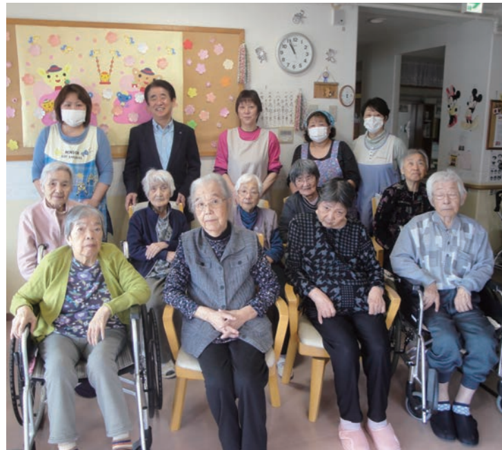
2階「海ユニット」 この通り元気だから心配いらないからね